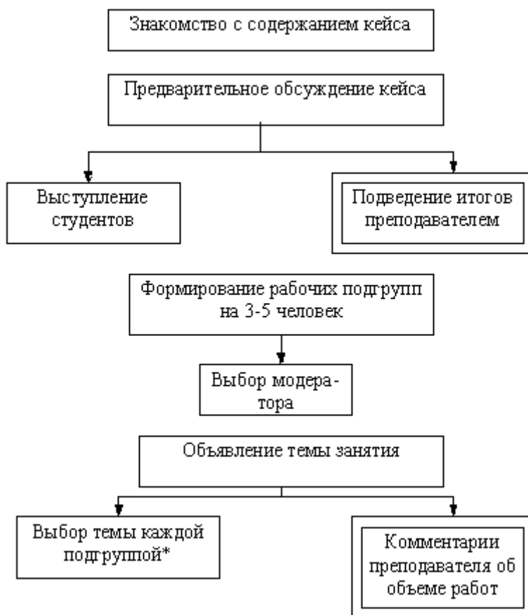
Схема 1. Стадия организации работы над кейсом

Последовательность организации и проведения занятий представлена на рисунках.